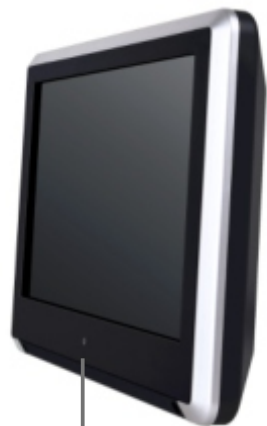
Вкл. / Выкл. питания